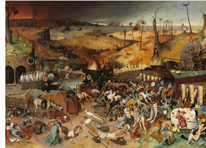
Pieter Bruegel el Viejo: El triunfo de la Muerte